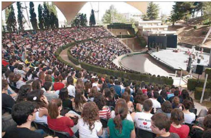
L'«Antígona» de Sòfocles dins del Festival de Teatre Grecollatí a Tarragona ■ J.C. LEÓN