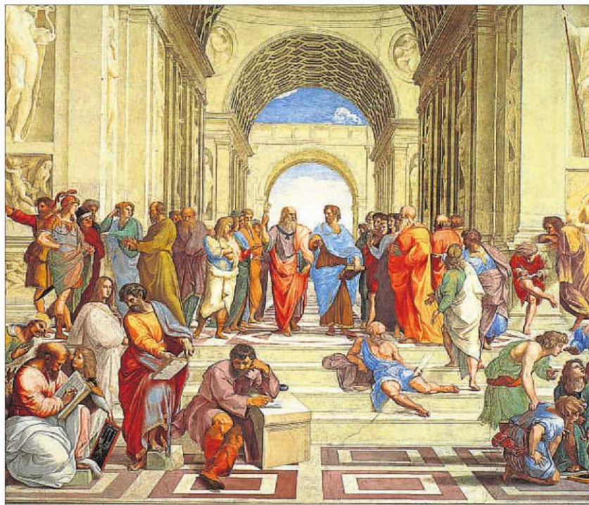
L'assignatura de filosofia és la més perjudicada per la llei Wert; a la imatge, L'escola d'Atenes

ció de les humanitats en els plans d'estudis, situació que s'"agreuja" amb la posada en marxa de la Lomce, la llei educativa aprovada pel PP, van alertar ahir durant la presentació del manifest. Les disciplines humanístiques més perjudicades de la llei Wert són la filosofia i l'ètica, que només seran assignatures obligatòries en un únic curs, primer de batxillerat. En els altres nivells passaran a ser matèries optatives. La degradació de la filosofia s'agreuja amb el currículum que ha elaborat el Ministeri d'Educació, segons denuncien els professors. Tant en l'optativa d'ètica de 4t d'ESO com en filosofia de 1r de batxille-